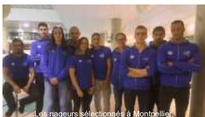
Les nageurs sélectionnés à Montpellier.