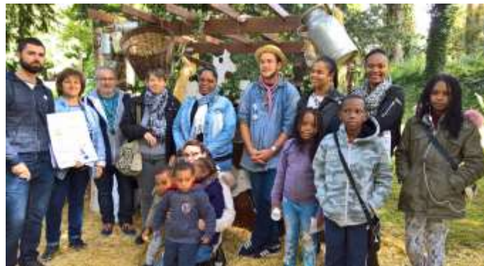
Sortie pédagogique au jardin Dupeyroux.

Cette dynamique s'est poursuivie le week-end suivant (samedi 23 septembre) avec une sortie à la Fondation Good Planet au domaine Longchamp (association présidée par le photographe Yann Arthus BERTRAND) qui avait mis en place l'évènement sur la nu-