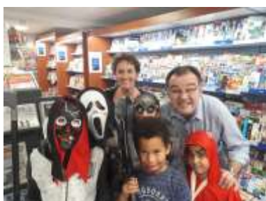
À la librairie Mag Press.

Le mardi 31 octobre, les commerçants de Créteil Village ont assisté à un défilé de petit monstre durant 1h à l'occasion d'Halloween. Leur gentillesse ont ravi les enfants qui sont rentrés chez eux les poches pleines de friandises !