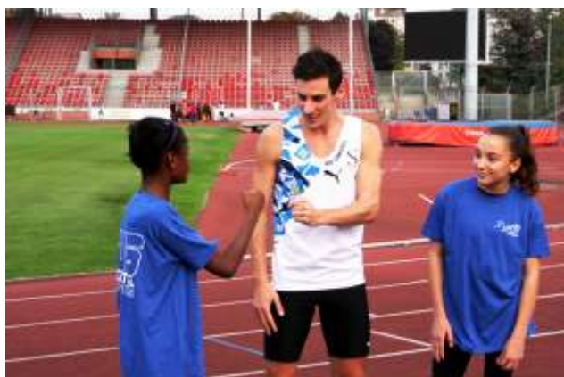
Une partie de chifoumi avec les jeunes de l'école d'athlétisme.