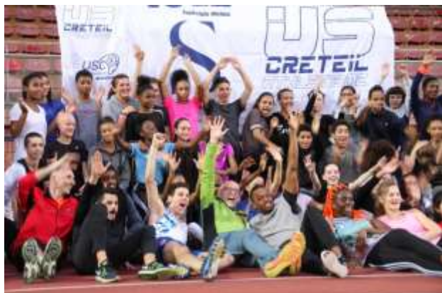
Une photo de groupe pour terminer.