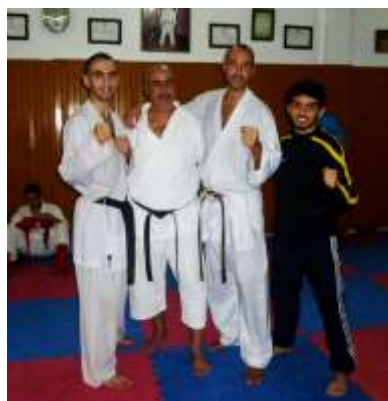
Entraînements au club Saada à Tanger.

de travailler avec des combattants talentueux.