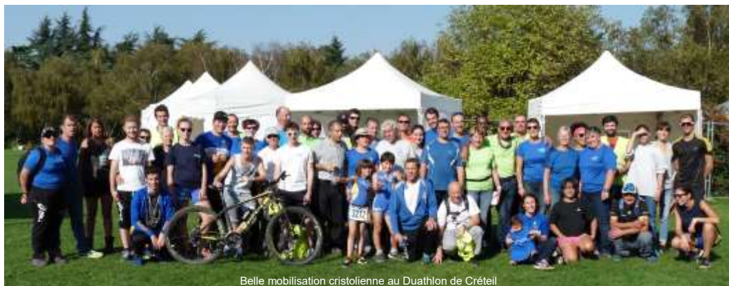
Belle mobilisation cristolienne au Duathlon de Créteil