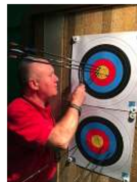
Vérification par l'arbitre.