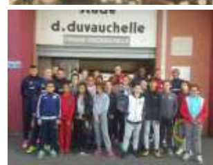
A l'entrée du Stade Duvauchelle pour la séance de « cécifoot ».

Mélangant à leur séance biquotidienne en piscine, séances de préparation mentale, d'étirements, les nageurs ont vécu de drôles moments en alternant des séances de cécifoot avec Sébastien FONTAINE, responsable de l'école de football de l'US Créteil Lusitanos, et un ciné débat sur le « bien vivre-ensemble » avec Habib BENAMAR de la ville de Créteil.