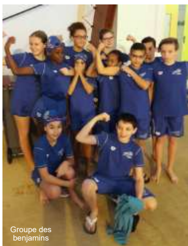
Groupe des benjamins

Nos nageurs du groupe de benjamins ont participé à un stage sportif durant 9 jours durant les vacances scolaires de la Toussaint.