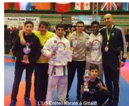
L'US Créteil Karaté à Sittard.