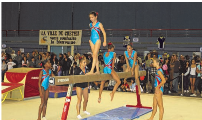
Une des nombreuses démonstrations, celle de la gymnastique artistique.