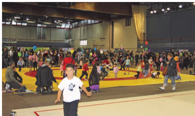
Les enfants présents ont investi le tapis de lutte après les démonstrations.