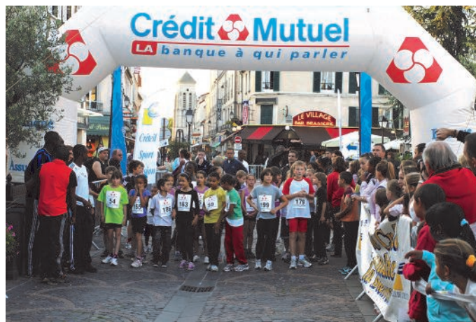
Départ de la course du kilomètre.