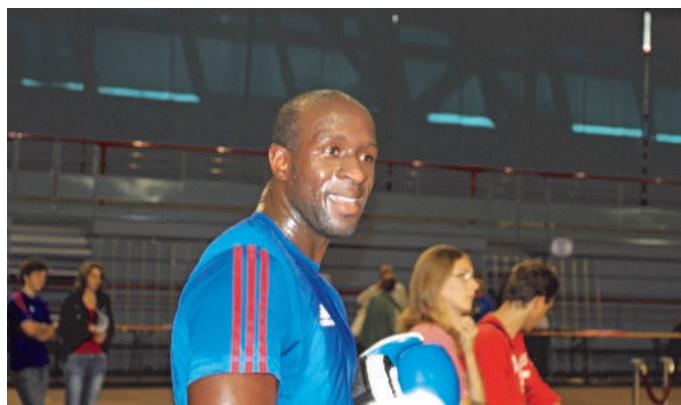
Slimane SISSOKO, champion du Monde de Savate-boxe française était venu faire une démonstration de son sport avec les jeunes du club.