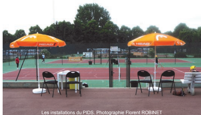
Les installations du PIDS.