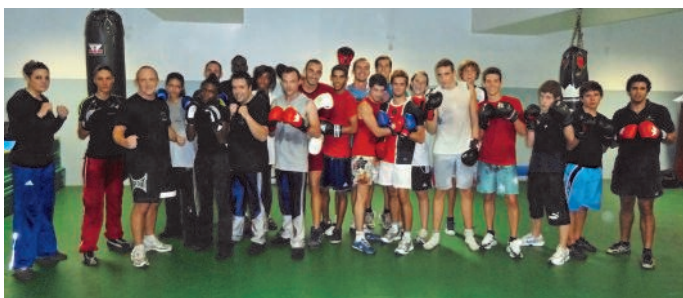
Les nageurs de l'USC dans le cadre de leur préparation physique (16/09/11)

Un cours de boxe française pour lancer la saison, voilà un événement comme on aimerait en voir plus souvent. Les nageurs de l'équipe 1 de l'US Créteil Natation ont participé à un cours avec nos compétiteurs afin de compléter leur préparation physique. Une bonne ambiance et des nageurs fatigués mais satisfaits. Conclusion : il faut développer les activités inter-associations.