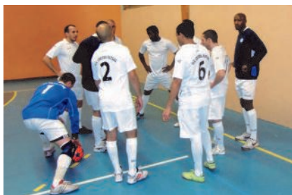
Auteurs d'une sérieuse préparation d'avant saison, les Béliers attaquent la saison 2011-2012 avec l'objectif inchangé de rejoindre le championnat National