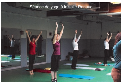
Séance de yoga à la salle Renaud

Mais les activités traditionnelles sont toujours proposées, au cours de 19 séances hebdomadaires, menées par des animateurs tous diplômés.