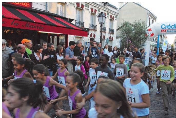
Départ de la course des 2 kilomètres.