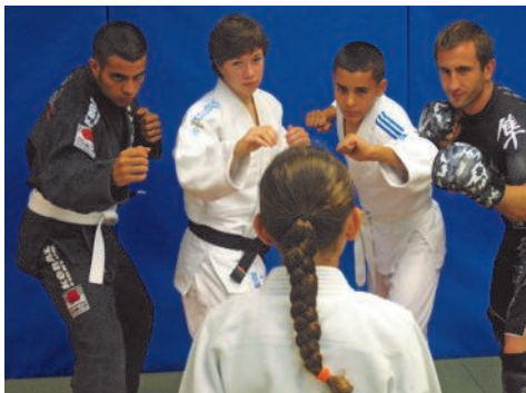
Judoka et Jujitsu

Le Judo et le Jujitsu à Créteil, c'est pour toute la famille. Parents, enfants, à chacun son tatami !