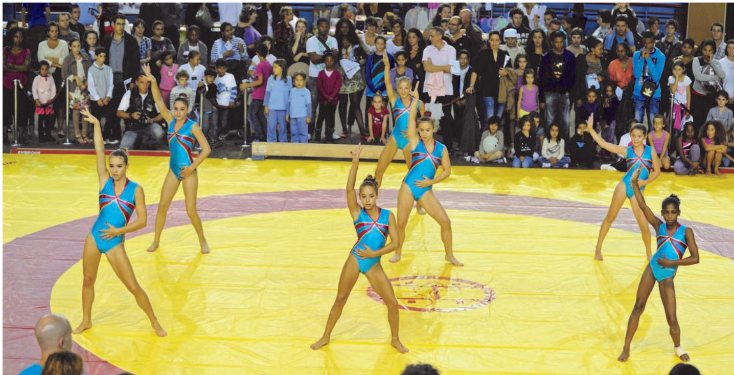
Les gymnastes de l'US Créteil Gymnastique artistique, lors de la démonstration à la Broc'sport, le dimanche 11 septembre 2011.

C'est l'heure maintenant de la rentrée. Les inscriptions ont débuté depuis début septembre et la Broc'sport a constitué le moment fort de cette rentrée. Beaucoup d'inscriptions et une belle démonstration de nos gymnastes qui ont été chaleureusement applaudies par le public resté très nombreux pour admirer leurs prouesses.