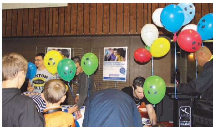
Le stand du Crédit Mutuel, notre partenaire.