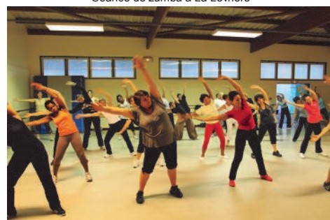
Correspondante : Dominique LEUDIERE