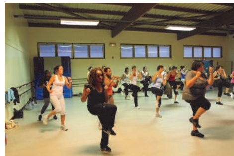
Séance de zumba à La Lévière

Nul besoin d'être bon danseur, l'essentiel étant de se dépenser dans la bonne humeur.