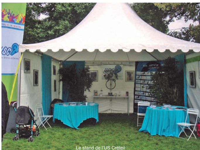
Le stand de l'US Créteil