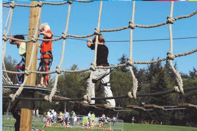
Quelques unes des nombreuses animations proposées gratuitement.