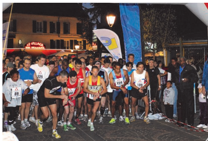
Départ de la course des 8 kilomètres.