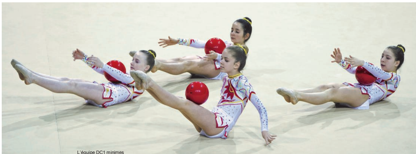
L'équipe DC1 minimes