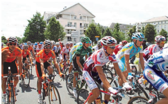
Le départ du Tour à Créteil.