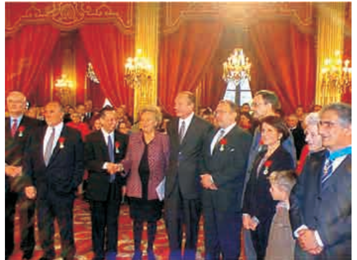
Jean-Michel BRUN, aux côtés de Monsieur Jacques CHIRAC, Président de la République Française, lors de la remise de la Légion d'Honneur à l'Elysée.

En la circonstance, formons le vœu d'être entendus par les médias car ils détiennent l'étincelle qui transforme le possible en réel !