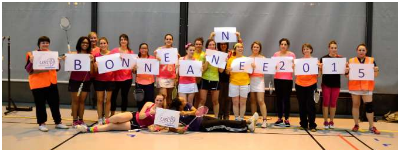
Photo prise à l'occasion de la « soirée filles », par Sandro Cabriole.

Le bureau de l'US Créteil Badminton ainsi que l'encadrement technique vous souhaitent une bonne année 2015. Que cette année soit pour vous source de bonheur, de joie, de prospérité et de réussite dans votre vie familiale, professionnelle et sportive.