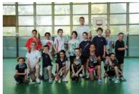
Le groupe d'entraînement « jeunes ».