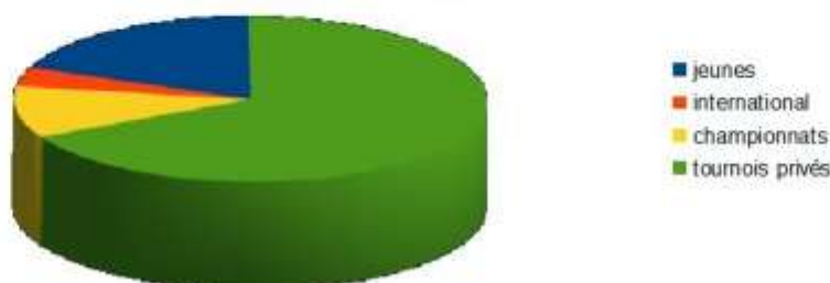
Nombre de matches joués

Les cristoliens ont joué au total 2308 matches cette saison, et il reste encore quelques tournois à disputer d'ici juillet. 1146 ont été remportés soit environ 50% de victoires. Les matches par équipes sont au nombre 1046.