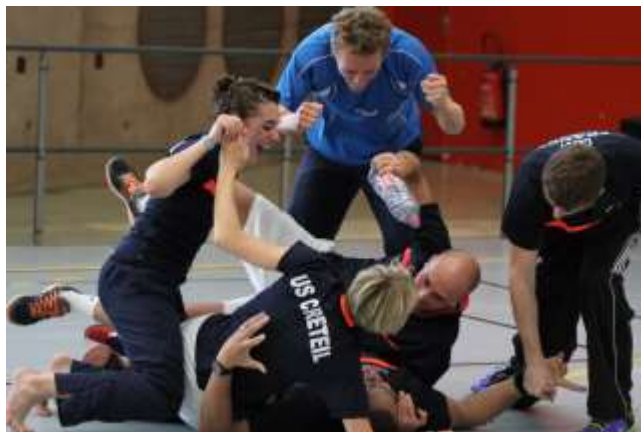
La joie éclate après la victoire.

(Retrouvez l'intégralité de l'Interview exclusive de Didier NOURRY sur badminton.uscreteil.com )