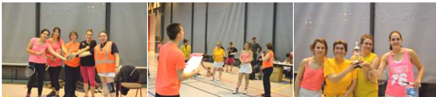
Quelques images de la « soirée filles ».

Suite article extrait du journal « Contacts US » n°86 de janvier 2015.