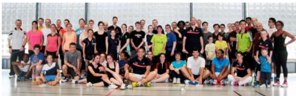
Article extrait du journal « Contacts US » n° 88 de juillet 2015.