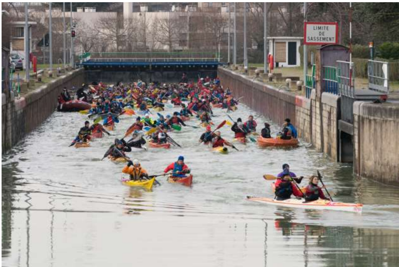
Sortie de l'écluse de Saint-Maur lors de l'édition 2015 - Crédit : Bruno LOUIS

Elle se tiendra le dimanche 22 Janvier 2017. Pour l'occasion entre 100 et 150 pagayeurs de toute la région viendront naviguer autour de la boucle de Saint-Maur. Au menu : départ du club de Champigny, pause déjeuner à Créteil, passage de l'écluse de Créteil et de Saint-Maur, passage du tunnel de Saint-Maur, tour de l'île Fanac et portage au niveau du barrage de Joinville avant de redescendre sur le club de Champigny ! Venez apprécier le passage des embarcations, notamment en venant sur le pont de Créteil.