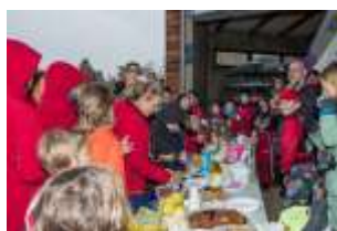
Correspondante : Valérie GUILBERT