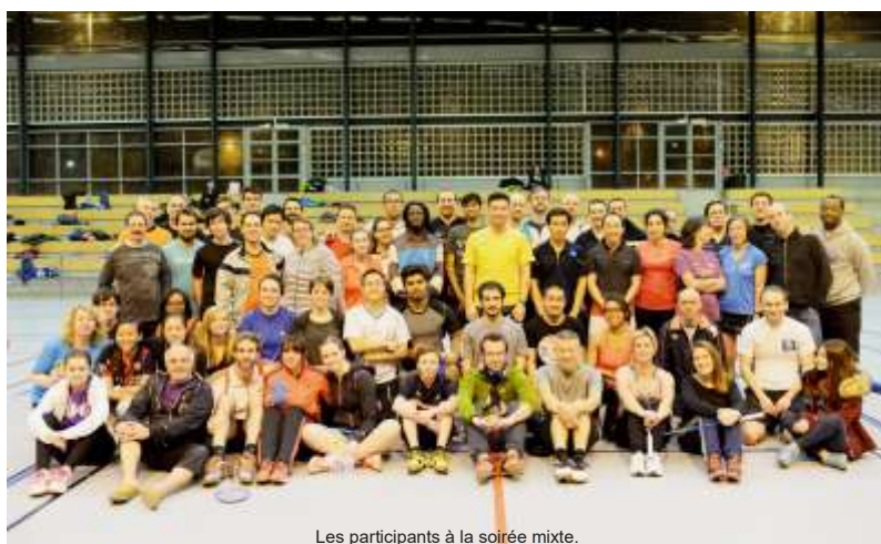
Les participants à la soirée mixte.