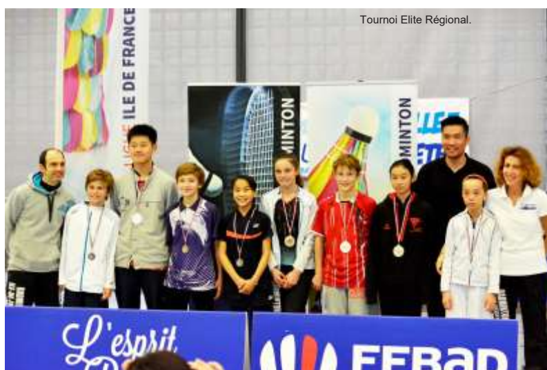
Tournoi Elite Régional.