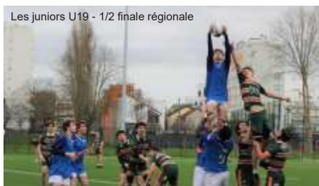
Les juniors U19 - 1/2 finale régionale

Après les matches de classement, verra le temps du rugby à 7, pratique qui pourra être suivie durant les prochains jeux de Paris 2024.