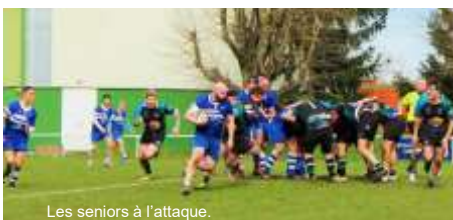
Les seniors à l'attaque.

Les seniors ont eu de bons résultats dernièrement, en s'imposant notamment contre leurs poursuivants et voient la fin de saison arriver avec un maintien pratiquement assuré si le cap est maintenu.