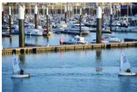
U15 2: retour d'entraînement, port de plaisance du Havre.