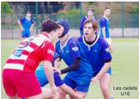
Les cadets U16

Les deux équipes se sont qualifiées pour les phases finales régionales et se sont hissées respectivement en ¼ de finale de régionale 1 et en ½ finale de régionale 2. De bons résultats, même s'il y avait la place pour passer un tour de plus peut-être.