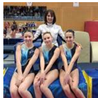
FED A TC sélectionnée en Finale ID.