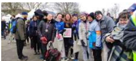
Groupe Bike and run du Nautil dimanche 21 janvier 2024.

Cette course par équipe de 2 est labellisée triathlon féminin et s'est engagée à délivrer des récompenses équivalentes à celles des hommes. Accessible à tous les niveaux et tous les profils, elle a eu le succès escompté.