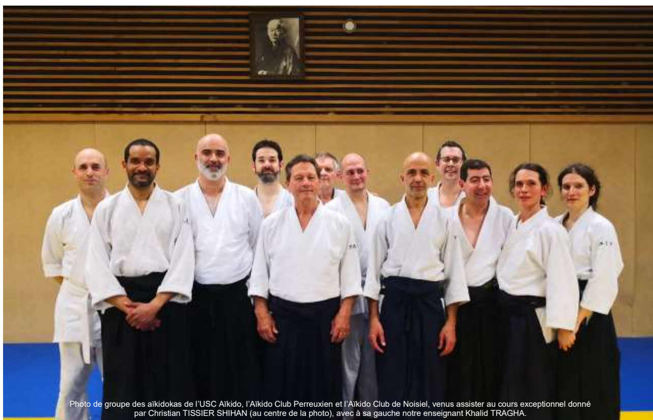
Photo de groupe des aikidokas de l'USC Aïkido, l'Aïkido Club Perreuxien et l'Aïkido Club de Noisiel, venus assister au cours exceptionnel donné par Christian TISSIER SHIHAN (au centre de la photo), avec à sa gauche notre enseignant Khalid TRAGHA.

Cette belle soirée sportive s'est clôturée autour d'un pot de l'amitié.