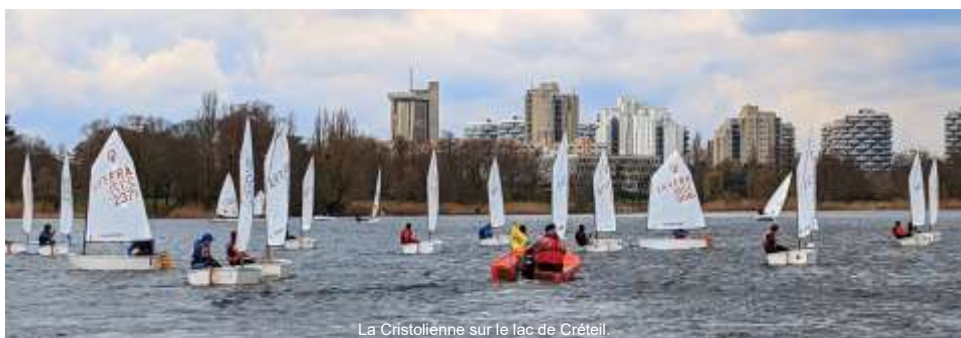
La Cristolienne sur le lac de Créteil.