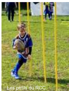
Les petits du RCC.

La période hivernale a vu les matches défilier, du sud, à l'est et au nord de l'Île-de-France, nos jeunes bleus et blancs