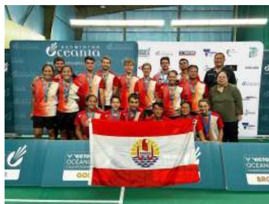
L'équipe de Tahiti.

Éliminé au premier tour de la compétition individuelle, il a permis à l'équipe de Tahiti de décrocher une médaille de bronze grâce à ses 2 victoires importantes en simple.