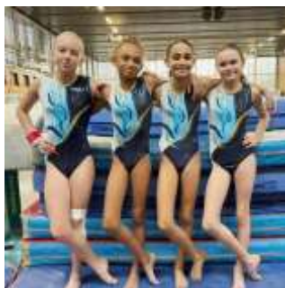
TR 1 10-13ans.