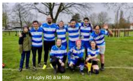
Le rugby R5 à la fête.

Du sport et de l'amusement : la recette de l'épanouissement.