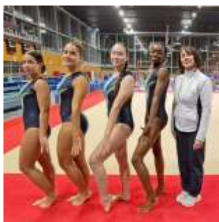
TR 1 - Sélectionnées en Finale Régionale.