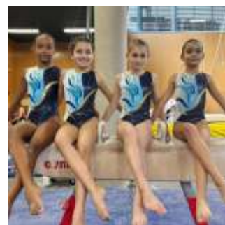
TR 1 10-11ans.