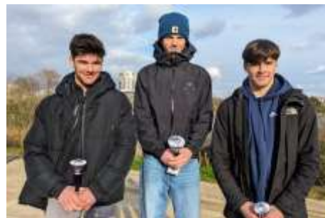
Le podium ILCA6.