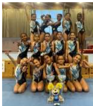
Le collectif des poussines Championnes et vice-championnes ID.