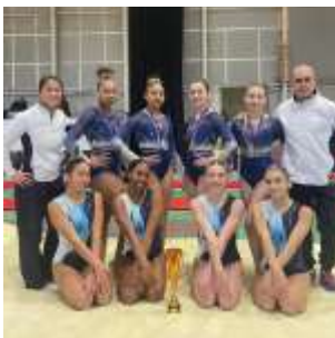
DN- Vice championne ID et PERF REG sélectionnées en Finale.