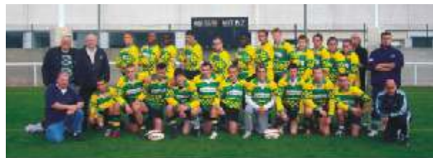
Équipe juniors 2006-2007.

Nous espérons également un réel retour dans les installations sportives, afin de pouvoir proposer tout notre savoir faire pour développer nos actions dans les écoles, collèges et quartiers.