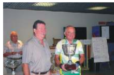
Remises de récompenses de l'ATIF 2006. Photographies Jean MASINGUE - CONTACTS US.