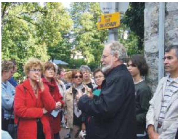
Près de la Maison de l'Abbaye, communauté intellectuelle et artistique (1906/1908) dont l'écrivain Georges DUHAMEL fit partie.