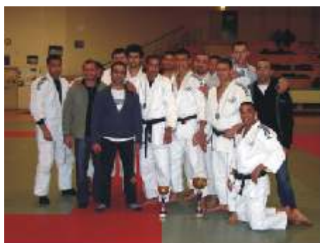
L'équipe de division nationale.

Créteil a même réussi l'exploit d'être classé par la FFJDA parmi les 10 meilleurs clubs français ! Il faut dire qu'en moins de deux ans, l'équipe cristolienne a réussi à monter en division 1 et de participer à la demi-finale du championnat de France par équipes. D'ailleurs il s'en est fallu de peu que nos cristoliens participent à la finale !!!