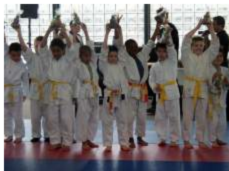
La fête "Choco-Baby Judo".

A l'US Créteil Judo, plus de 800 adhérents, jeunes et moins jeunes, valides ou handicapés pratiquent le judo ou une discipline associée pour le loisir ou pour la compétition. Les jeunes manifestent d'ailleurs chaque année leur satisfaction devant des centaines de parents lors des festivités du Choco Baby Judo ou du tournoi de fin d'année !