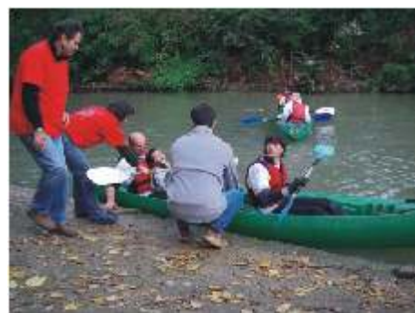
Un peu d'aide pour le débarquement.