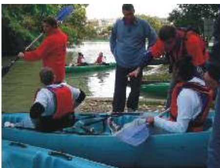
Les mêmes bateaux pour tous, avec quelques aménagements.

Des épreuves sur l'eau, en intégrant une personne à mobilité réduite par équipage, ont donné l'occasion de découvrir un sport de