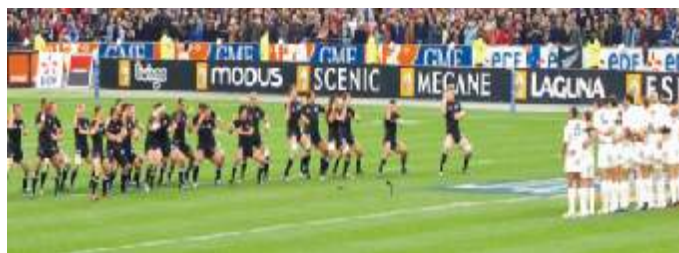
Le "Haka" Photographie Nicolas BIACHE-Contacts US.

Malgré la défaite, tous ont gardé un espoir pour l'échéance qui arrive en 2007. Auront-ils raison ?