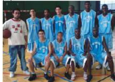
L'équipe cadets 1.

Et nos encouragements vont à Bertrand MARTIN pour son brevet d'état niveau 2 qu'il prépare cette année.