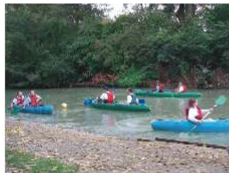
Valide et handicapé, ...pagayeur tout simplement.