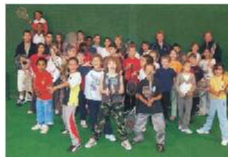
Photographies US Tennis.

Ce stage s'avère avoir été un moment fabuleux de partage et suscite des retours très positifs. L'enthousiasme des participants ne s'est jamais démenti et surtout pas, lors de la dernière journée ou nos jeunes joueurs ont pu assister au dernier Masters Série de l'année. Certains ont pu même obtenir des autographes de Richard GASQUET, Sébastien GROSJEAN, à l'issue de leur victoire en double. Que de souvenirs !