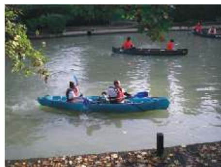
Le virage, plus subtile à négocier.