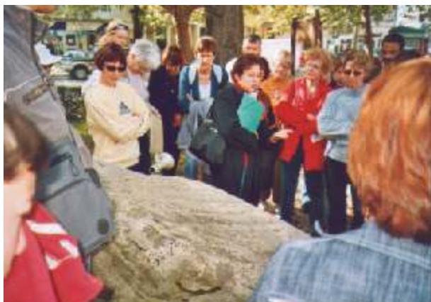
Le polissoir, 5 000 ans avant notre ère ... environ deux tonnes et demie !